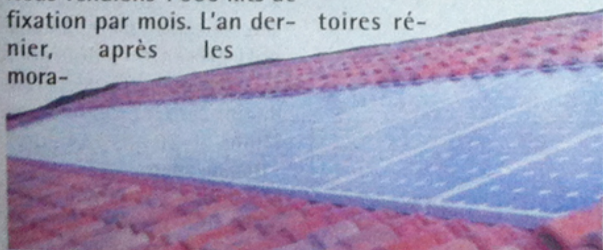
◆ Les kits de Cofam Energy permettent de fixer les panneaux solaires sur n'importe quelle toiture.

«Quand nous avons commencé en 2007, le photovoltaïque était en plein essor. C'était l'époque du Grenelle de l'environnement. Les gens qui souhaitaient s'équiper touchaient des aides. En 2010, nous sommes devenus leader sur notre créneau. Nous vendions 1 000 kits de fixation par mois. L'an dernier, après les